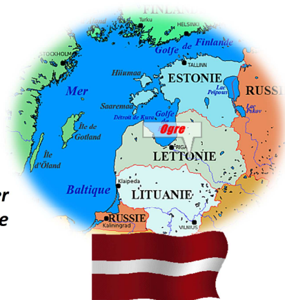
Drapeau de la Lettonie

Chrétiens de Metz Rive Gauche, Communautés des Ponts, du Saint Quentin, des Fontaines, ne manquez de venir prier ensemble en vue de l'Eglise une et universelle. Le Mercredi 20 Janvier à 20h00 à l'église Notre Dame de Lourdes.